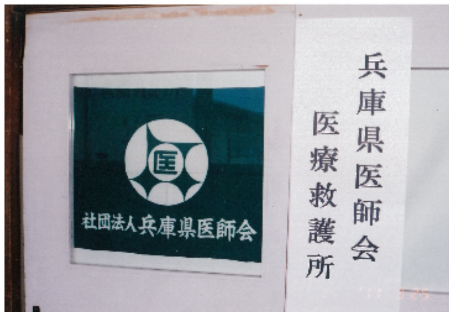
兵庫県医師会医療救護所