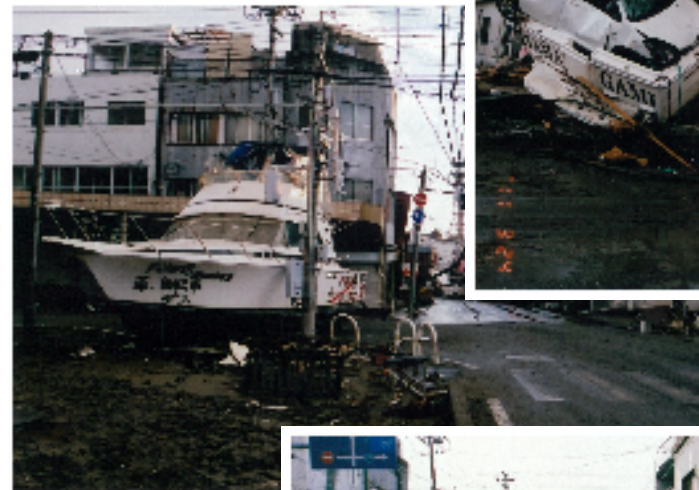
▲ ▲ ▲ 旧北上川周辺。津波によって市街地へ船が打ち上げられている。