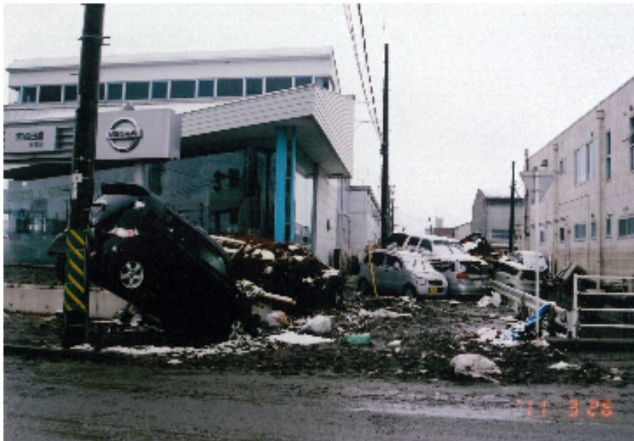
▲ 石巻市街地 津波の影響あり 車散乱