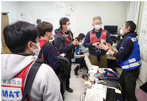
穴水町の調整本部で現地本部長と意見交換